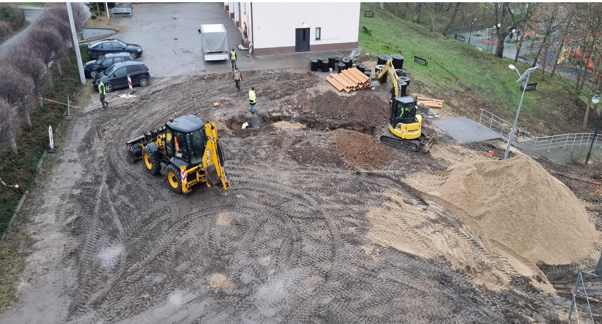
Parking przy Urzędzie Miejskim w Miłakowie