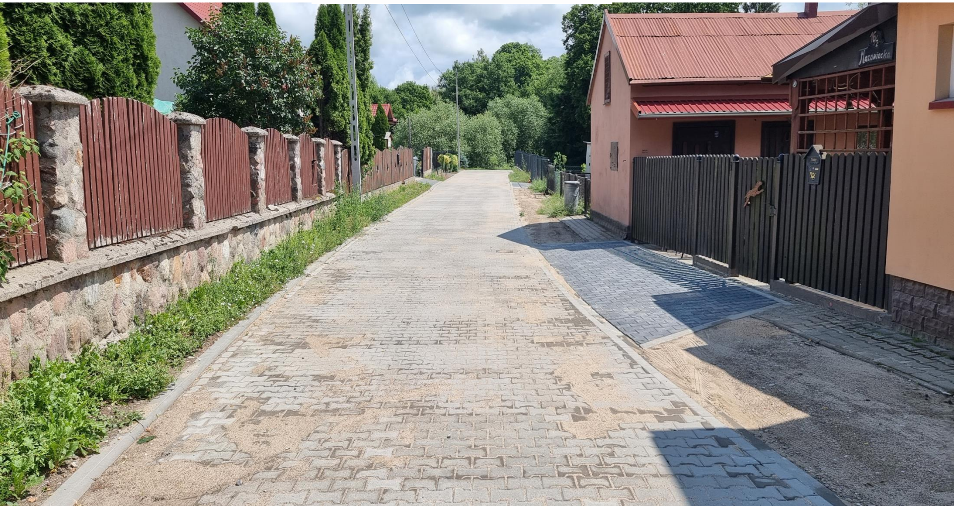
ulica Mazowiecka I odcinek