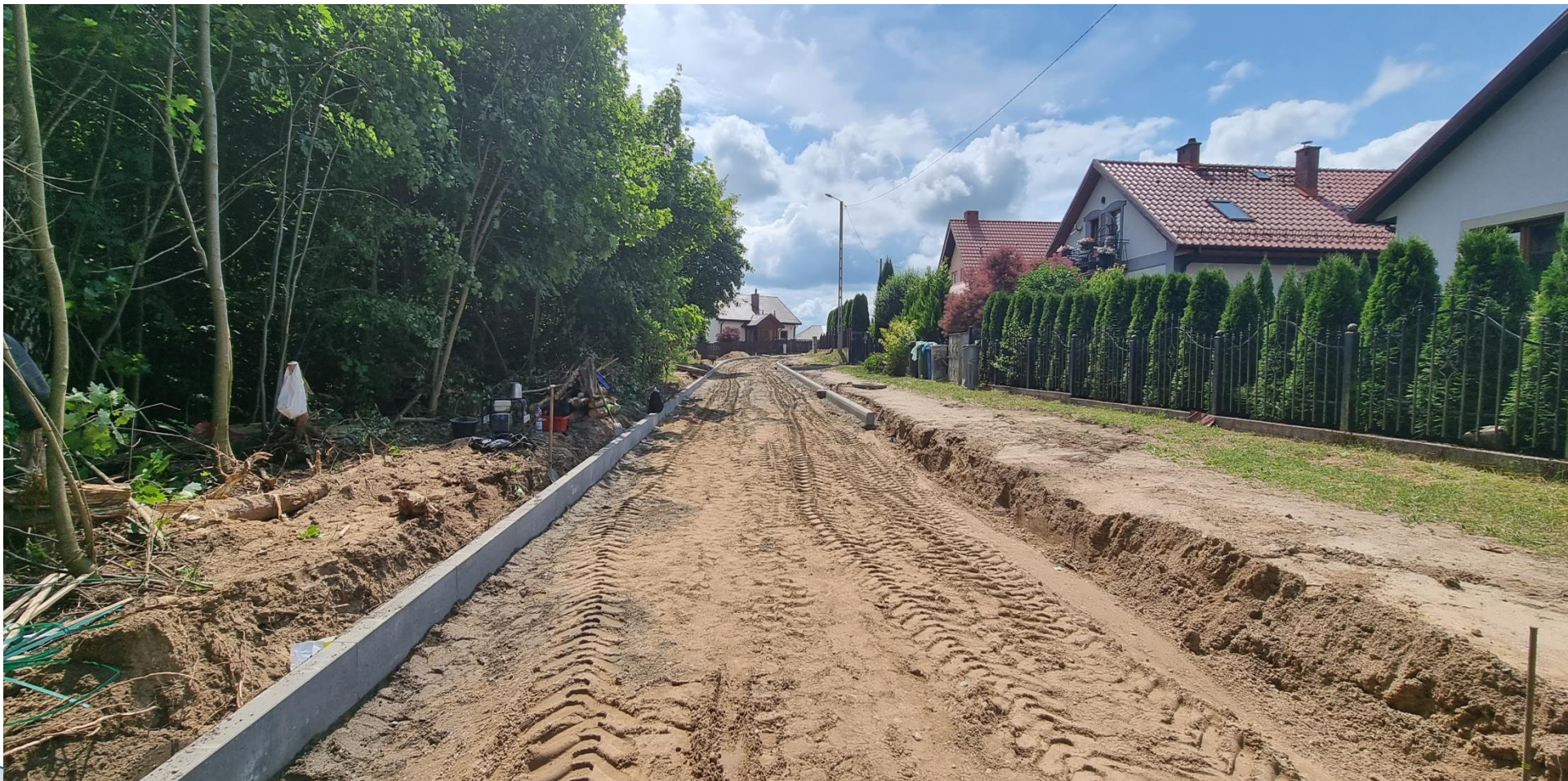
ulica Mazowiecka II odcinek