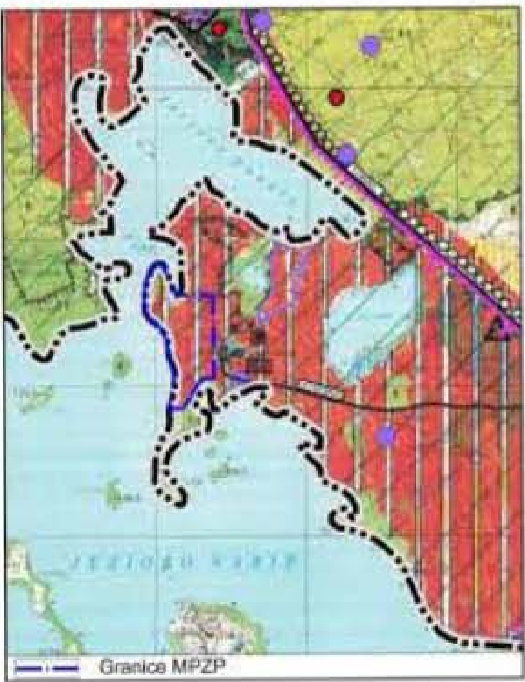
Wyrys ze Studium Uwarunkowań i Kierunków Zagospodarowania Przestrzennego Gminy Miłakowo

ZAŁĄCZNIK NR 1 DO UCHWAŁY NR LII/314/2014 RADY MIEJSKIEJ W MIŁAKOWIE Z DNIA 23 WRZEŚNIA 2014R.